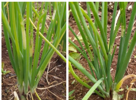
Gambar 2. Gejala Kerusakan Tanaman Bawang Merah Yang Disebabkan S. exigua Hbn.