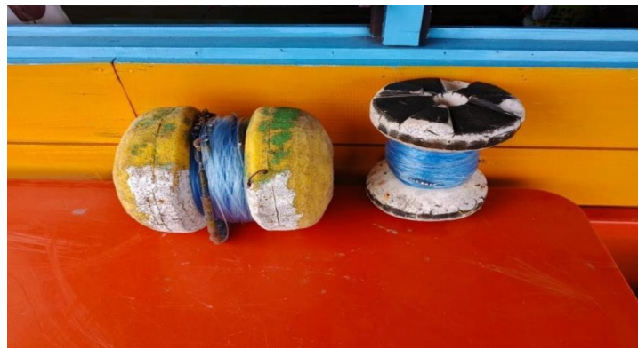
Gambar 3. Alat Tangkap

Alat tangkap pancing ulur atau hand line ialah alat yang sederhana, mudah dipakai dan ramah lingkungan. Alat Tangkap ini digunakan dalam operasi penangkapan ikan tuna yaitu hand line . Selain konstruksinya sederhana, metode pengoperasian mudah, tidak memerlukan modal yang besar dan kapal khusus. Alat tangkap terdiri dari gulungan tali, tali utama ( main line ), kili-kili ( swivel ), snap, pemberat, tali cabang ( branch line ) dan mata pancing ( hook ). Jenis alat tangkap Pancing dapat dilihat pada Gambar 3.