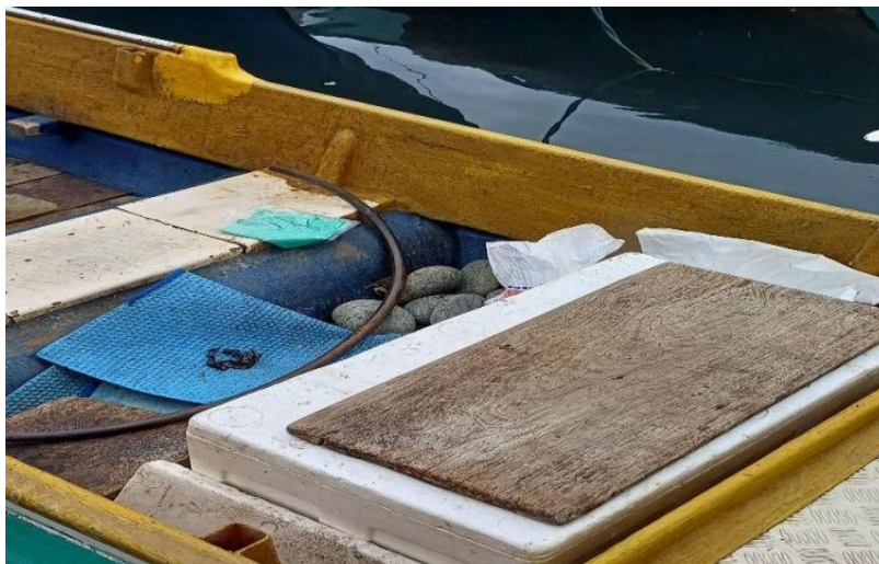
Gambar 5. Cool box

Cool box merupakan suatu tempat atau wadah penyimpanan produk yang bertujuan untuk melindungi, mencegah, atau menunda kerusakan maupun terjadinya penurunan mutu hasil kelautan dan perikanan. Penyediaan peralatan berupa cool box diharapkan dapat mempertahankan mutu hasil perikanan menggunakan es batu yang dipakai kisaran 10-14 es batu. Sampai dengan tingkat konsumen, meningkatkan pendapatan pemasaran ikan, dan mendukung peningkatan konsumsi ikan masyarakat menggunakan es batu yang dipakai 10 es batu. Ukuran cool box dengan dimensi dalam (mm) = 940 x 590 x 650 serta dimensi luar (mm)= 810 x 510 x 580. Jenis coolbox yang digunakan nelayan dapat dilihat pada Gambar 5.