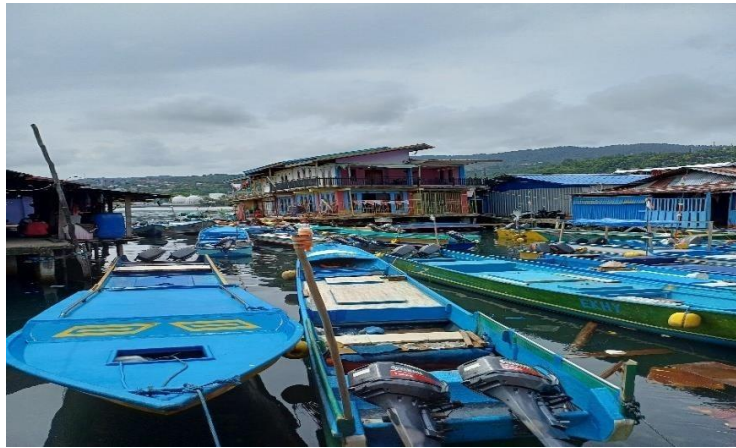
Gambar 2. Kapal

Ikan Tuna Sirip Kuning ( Thunnus albacares ) di Rumpon sekitar Pasir 6 (enam), perairan PNG dan Sarmi dengan panjang kapal 9 m (meter), lebar 1,20 m dan tinggi 1,30 cm m dengan ukuran 3 GT (Gambar 2). Kapal penangkapan yang digunakan biasanya menampung 1 sampai dengan 2 orang untuk melaut. Selain itu kapal penangkapan juga dilengkapi dengan GPS ( Global Positioning System ) dan Life Jacket yang diberikan oleh pihak DKP (Dinas Kelautan dan Perikanan) Provinsi Papua. Jenis kapal nelayan dapat dilihat pada Gambar 2.