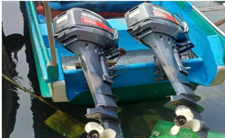
Gambar 4. Mesin motor tempel