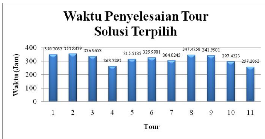
Waktu Penyelesaian Tur Solusi Terpilih

Berdasarkan model matematis fungsi tujuan diatas maka akan dipilih solusi yang paling layak sebagai hasil algoritma sequential insertion dalam pendistribusian minyak di UPms VIII (Maluku, Maluku Utara dan Papua). Tabel 5 memperlihatkan bahwa hasil percobaan ketiga merupakan solusi yang paling layak untuk diterapkan. Replikasi ketiga dipilih karena memiliki nilai fungsi tujuan terbaik yaitu 216397.63. Untuk waktu penyelesaian tiap tour solusi terpilih dapat dilihat pada Gambar 3.