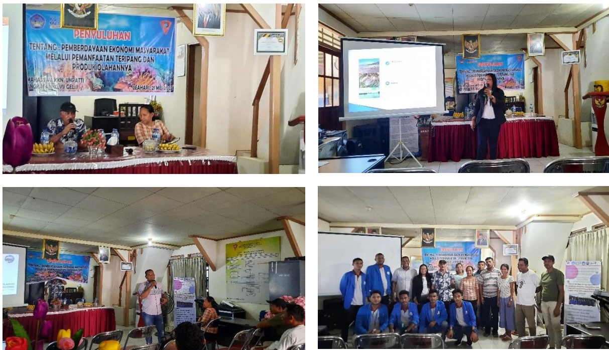
Gambar 2. Kegiatan Pelatihan Pemberdayaan Ekonomi Masyarakat Melalui Pemanfaatan Teripang dan Produk Olahannya di Negeri Leahari Kota Ambon.

Materi yang disampaikan dalam kegiatan pelatihan terdiri dari potensi dan karakteristik teripang di Maluku termasuk nilai ekonomisnya, teknologi pengolahan teripang kering dan teknologi pengolahan kerupuk teripang. Kegiatan pelatihan berjalan dengan lancar dan peserta sangat antusias mengikuti materi yang disampaikan, terlihat dengan begitu banyak pertanyaan yang disampaikan saat diskusi setelah materi disampaikan (Gambar 2).