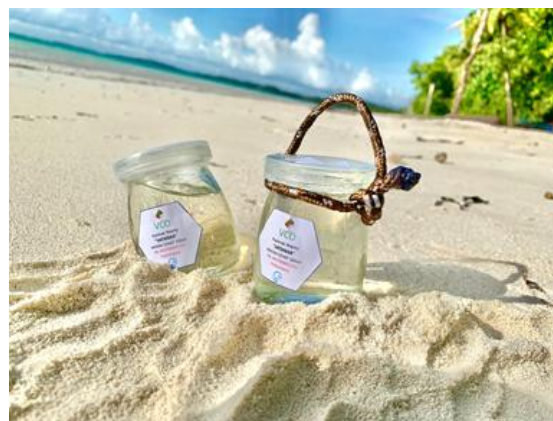
Gambar 5. Produk VCO dari Hasil Kegiatan dengan Koperasi Wanita Vatanar

memiliki rasa dominan atau menyerupai air kelapa dan memiliki bau khas kelapa atau tidak tengik. Pengemasan dengan botol selai kaca dimaksudkan untuk menjaga kualitas VCO. Produk VCO yang dihasilkan dari pelatihan dengan mitra dapat dilihat pada Gambar 5.