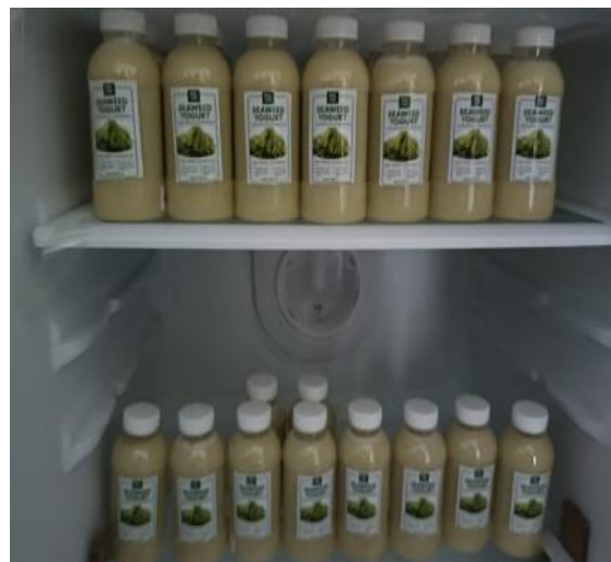
Gambar 3. Produk Yoghurt

Pembuatan yoghurt dilakukan selama 2 hari dengan menambahkan nanas sebagai bahan tambahan untuk memberikan aroma segar para yogurt dan memanfaatkan enzim bromelin yang terdapat dalam nanas untuk proses fermentasi yogurt yang didiamkan selama 1 hari. Hasil yang diperoleh disimpan dalam lemari pendingin untuk menghentikan proses fermentasi dalam pembuatan yoghurt. Yang dilakukan mitra dan tim pengabdian adalah melakukan uji rasa, aroma dan tekstur. Uji organoleptik yang dilakukan sudah menghasilkan rasa, aroma dan tekstur yang sesuai dengan yogurt yang diinginkan. Produk yang dihasilkan dapat dilihat pada Gambar 3.