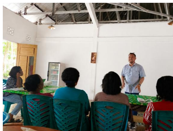
Gambar 1. Kegiatan pelatihan pembuatan yoghurt rumput laut Caulerpa dan virgin coconut oil (VCO) Bersama Koperasi Wanita Vatanar Desa Ngilngof

Kegiatan pengabdian kepada masyarakat dalam bentuk pelatihan pembuatan yoghurt rumput laut Caulerpa dan virgin coconut oil (VCO) dilakukan dengan baik Bersama Koperasi Wanita Vatanar Desa Ngilngof. Kegiatan ini berlangsung dalam 3 tahapan. Semua kegiatan dilakukan dengan pada tanggal 11-15 November Tahun 2025 dan diikuti oleh 5 orang mitra. Kehadiran mitra pada hari pertama dapat dilihat pada Gambar 1.