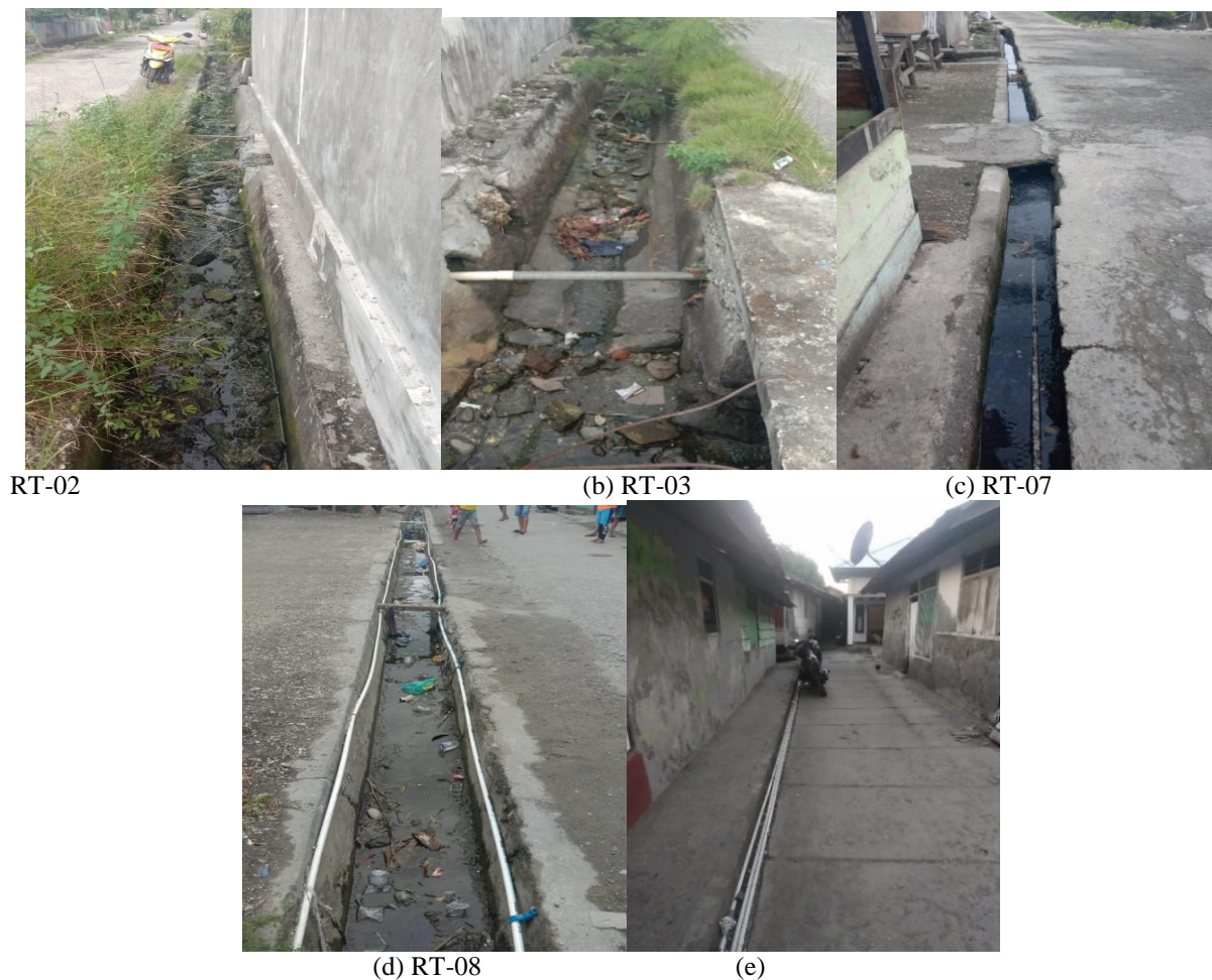
Gambar 2. Kondisi Drainase di Lokasi Penelitian

Gambar 3 (a, b, c, dan d) menunjukkan bahwa kondisi fisik saluran-saluran drainase di lokasi penelitian tidak dirawat dengan baik dan menjadi tempat pembuangan sampah dan tumbuhnya rumput (RT-02, RT-03, RT-08), sedangkan pada saluran drainase di RT-07, air tidak mengalir sehingga tergenang dalam saluran. Kondisi menyebabkan kapasitas tampung saluran-saluran ini menurun sehingga menyebabkan terjadinya luapan dan genangan saat terjadi hujan. Selain itu, Gambar 3 (e) menunjukkan bahwa dalam kompleks pemukiman halaman tertutup semen, dan tidak ada daerah resapan. Selain itu, tidak ada saluran pembuangan air hujan yang dapat menampung dan mengalirkan air yang mengalir di jalan. Atap rumah penduduk juga tidak menggunakan talang penampung sehingga semua air hujan jatuh ke permukaan tanah yang tertutup semen. Hal ini menyebabkan air hujan yang jatuh di kawasan pemukiman ini seluruhnya dapat tergenang dan menjadi limpasan permukaan.