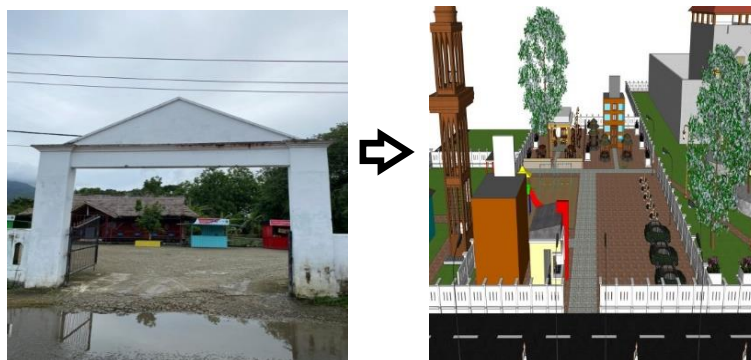
Gambar 7. Ilustrasi Gazebo, Museum, Kafe, dan Lahan Parkir

Ketersediaan lahan parkir tentunya harus memiliki pelayanan parkir yang baik agar dapat memanfaatkan kapasitas lahan parkir yang tersedia secara optimal.