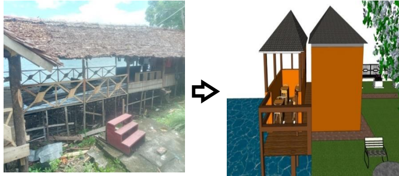
Gambar 8. Gambar Ilustrasi Kantin dan Klinik

Klinik yang direncanakan memiliki luas bangunan 9m 2 , digunakan sebagai tempat pengobatan penyakit-penyakit ringan seperti demam dan sebagainya.