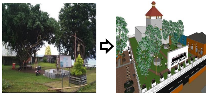
Gambar 5. Ilustrasi Dari Sarana Tempat Bersantai

Tempat bersantai digunakan bagi para wisatawan sebagai tempat untuk membaca buku, mendengarkan musik, atau sekedar obrolan dengan keluarga maupun teman.