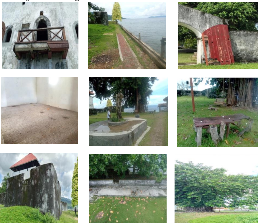
Gambar 2. Kondisi Fisik Kawasan Bersejarah Benteng Amsterdam

Sesuai dengan hasil observasi lapangan pada gambar di atas kita bisa melihat bahwasanya struktur bangunan seperti pagar, kayu, dan juga pintu pada kawasan bersejarah Benteng Amsterdam sudah mulai mengalami kerusakan dan juga pelapukan, serta pada area di dalam bangunan Benteng Amsterdam terlihat masih sering terdapatnya sisa-sisa kotoran hewan, dengan demikian hal ini membuat area di dalam bangunan menjadi sangat kotor dan juga bisa membuat ketidaknyamanan pengunjung apabila masuk ke dalam bangunan Benteng Amsterdam. Kemudian, Permasalahan lain yang ada pada kawasan bersejarah Benteng Amsterdam yaitu masih kurangnya fasilitas-fasilitas penunjang wisata seperti tempat duduk atau gazebo dan juga taman yang ada kurang terawat dengan baik. Selain itu, kondisi lingkungan pada area kawasan bersejarah masih terlihat kotor karena adanya sampah-sampah yang masih berserakan, baik itu sampah plastik maupun kotoran dedaunan, hal ini menunjukkan bahwa pengunjung maupun masyarakat yang ada di sekitar kawasan masih kurang menyadari betapa pentingnya kebersihan sehingga tidak heran mereka membuang