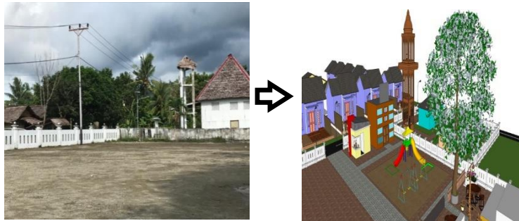
Gambar 6. Ilustrasi Toko Cinderamata, Pos Security, dan Wahana Permainan

Wahana permainan digunakan sebagai sarana hiburan bagi anak-anak.