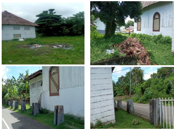
Gambar 3. Kondisi Fisik Kawasan Gereja Tua Immanuel