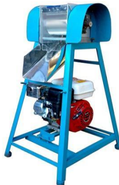
Gambar 1. Mesin parut kelapa

Motor penggerak menggunakan motor bakar sebagai penggerak. Motor bakar ini mengubah energi kimia bahan bakar menjadi energi mekanik. Motor bakar digunakan sebagai motor penggerak. Motor bakar atau lebih dikenal dengan nama mesin pembakaran dalam (internal combustion engine), adalah suatu jenis mesin yang prinsip kerjanya mengubah energi kimia bahan bakar menjadi energi kalor, kemudian diubah lagi menjadi energi mekanik atau gerak.