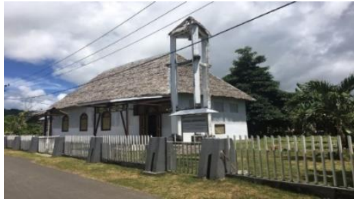
Gambar 2. Gereja tua imanuel

Gereja Tua Imanuel dibangun oleh Bangsa Portugis 2 tahun setelah gudang rempah/loji dibangun tepatnya pada tahun 1514 dengan nama Santo Jacobus yang merupakan gereja Katolik kemudian diambil alih oleh Belanda pada tahun 1605.