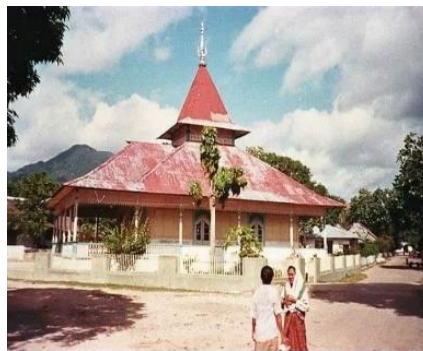
Gambar 3. Majid hasan sulaiman

Mesjid Hasan Sulaiman merupakan salah satu masjid tua yang ada di Negeri Hila. Nama masjid "Hasan Sulaiman" sendiri berasal dari seorang ulama besar Hila abad ke-17 M, yaitu Syaikh Hasan Sulaiman. Masjid ini dibangun pada masa siar Islam di Maluku. Bangunan masjid pertama berdiri pada abad 15 berbentuk surau tergantung dengan 4 pilar penyanggah. Bangunan masjid kedua pada abad ke 18 berbentuk pyramid dan bangunan ketiga pada abad 20 dan masih bertahan hingga saat ini.