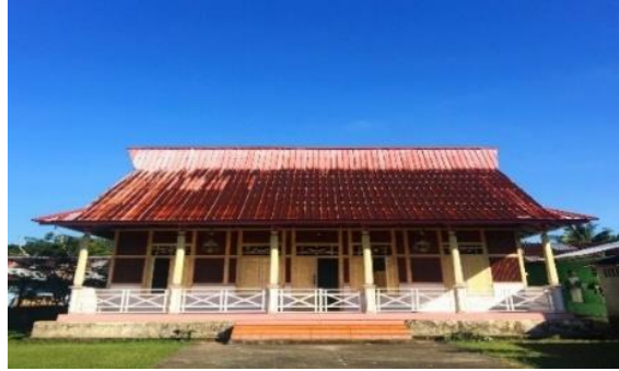
Gambar 4. Rumah pusaka lating upal

Rumah Pusaka Lating Upal dibangun oleh leluhur Moyang Ma'wiyah pada tahun 1679 setelah terjadi tsunami yang melanda pulau Ambon pada 1674. Rumah ini disebut Rumah Upal karena 75% bahan bangunannya dari gaba-gaba. Kata "Upal" diambil dari Bahasa Hila yang memiliki arti gaba-gaba yang berasal dari pelepah atau tangkai daun sagu.