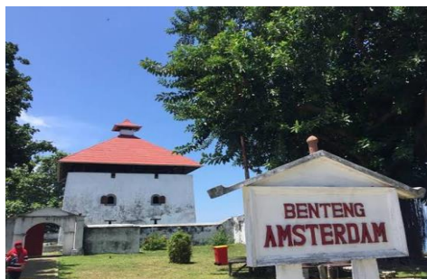
Gambar 1. Benteng amsterdam

Benteng Amsterdam merupakan sebuah gudang rempah yang dimiliki Portugis. Portugis pertama kali menginjakkan kakinya di Maluku pada tahun 1512 yang dipimpin oleh seorang Gubernur Jenderal bernama Magelhaens dan seorang Sekertasi Jenderal bernama Fransesco Serrao. Ketika Pulau Ambon dikuasai oleh Vereenigde Oostindische Compagnie (VOC) pada tahun 1605 secara otomatis benteng ini dikuasai oleh VOC dan dijadikan loji pertahanan.