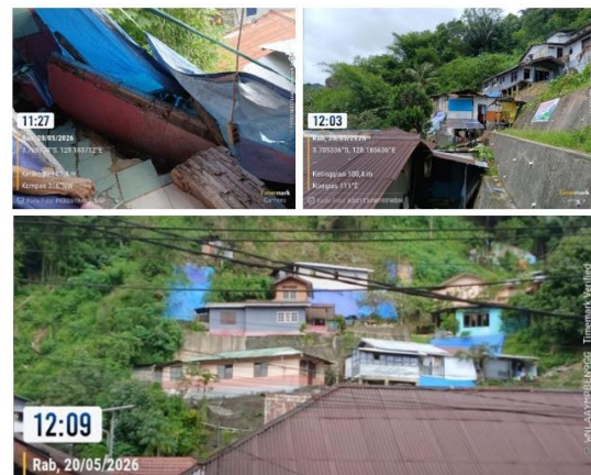
Gambar 3. Rumah Yang Terdampak dan Mengalami Kerusakan Akibat Longsor

Longsor di Kelurahan Batu Gadjah terjadi pada sekitar 8 titik, didepan, tengah maupun belakang kelurahan Batu Gadjah, namun tidak meliputi semua areal. Kawasan ini memiliki karakteristik berada pada kelerengan sudut kemiringan lebih dari 30%, permukiman sedang sampai padat, dan dibangun di atas batuan/bahan induk loss material/tuf yang tingkat pelapukannya sangat tinggi. Seperti yang dikemukakan oleh (Kastanya & Puturu, 2020) bahwa ada dua faktor pemicu terjadinya longsor di kelurahan Batu Gadjah yaitu faktor pemicu dinamis kemiringan lereng, curah hujan dan penutup lahan, gempabumi yang terjadi pada tahun 2012, 2013, dan faktor pemicu statis batuan dan tanah. Oleh karena itu kawasan keretakan ini oleh pemerintah Kota Ambon ditetapkan sebagai kawasan rawan bencana longsor di Kelurahan Batu Gadjah, berdasarkan hasil penelitian Puturu (2018) dengan menggunakan metode jaringan syaraf tiruan dan regresi logistik, wilayah ini juga termasuk wilayah rawan tinggi terhadap kejadian longsor, ini dibuktikan dengan hasil verifikasi lapangan yang dilakukan. Jumlah rumah yang terdampa kejadian longsor di tahun 2024-2025 sekitar 45 rumah dan yang mengalami kerusakan 15 rumah, seperti ditunjukkan pada Gambar 3 berikut.