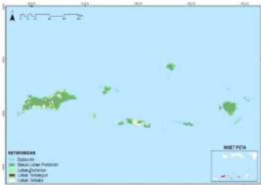
Gambar 2. Tutupan Lahan Tahun 2012

Citra satelit yang digunakan untuk menganalisis perubahan tutupan lahan tahun 2012, yaitu Landsat 5 wilayah Kabupaten Maluku Barat Daya yang direkam pada bulan Agustus tahun 2012. Interpretasi citra Landsat 5 dalam penelitian ini dilakukan secara visual dengan cara mendelineasi atau digitasi on screen dengan menggunakan software ArcGIS 10.8.