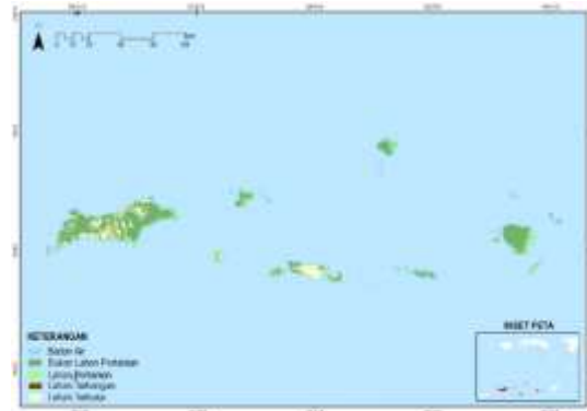
Gambar 3. Tutupan Lahan Tahun 2017

323079,51 ha dan badan air merupakan tutupan lahan yang paling sedikit sebesar 1199,32 ha dan total luasan tutupan lahan terbangun sebesar 2070,80 ha. Secara keseluruhan tabel luasan tutupan lahan dapat dilihat pada Tabel 1.