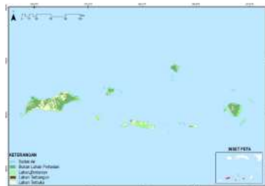
Gambar 4. Tutupan Lahan Tahun 2022

Pada Tahun 2022 tutupan lahan masih di dominasi oleh tutupan lahan bukan lahan pertanian yaitu sebesar 208.192,81 ha dan badan air merupakan tutupan lahan yang paling sedikit sebesar 1.168,04 ha dan total luasan tutupan lahan terbangun sebesar 5.509,78 ha. Secara spasial tutupan lahan Kabupaten Maluku Barat Daya dapat dilihat pada Gambar 4.