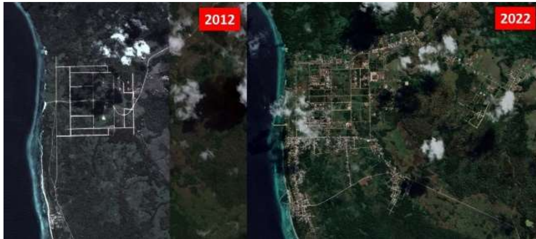
Gambar 5. Perkembangan Lahan Terbangun di Tiakur

regulasi yang sudah dibuat (Y. Liu, 2020). Perkembangan lahan terbangun di Tiakur pada tahun 2012 dan 2022 dapat dilihat pada Gambar 5.