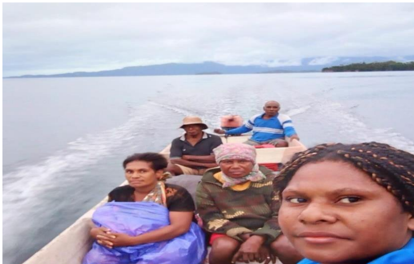
Gambar 4. Sampang Merupakan Salah Satu Fasilitas.

Kabupaten Kaimana dalam hal ini Dinas pariwisata untuk melakukan pengembangan wisata di pantai Teluk Triton. Berdasarkan data yang diperoleh dari Dinas Pariwisata Kab. Kaimana diketahui bahwa terdapat 39 objek wisata di Kabupaten Kaimana dan Teluk Triton merupakan salah satu didalamnya. Hasil wawancara menunjukkan bahwa Teluk Triton bukan merupakan satu-satunya tujuan utama wisatawan untuk berlibur ke Kabupaten Kaimana. Jumlah wisatawan yang berkunjung dan berwisata di Teluk Triton masih sedikit, hal ini karena ketidak tahuan masyarakat atau public terhadap keberadaan wisata alam di Teluk Triton.