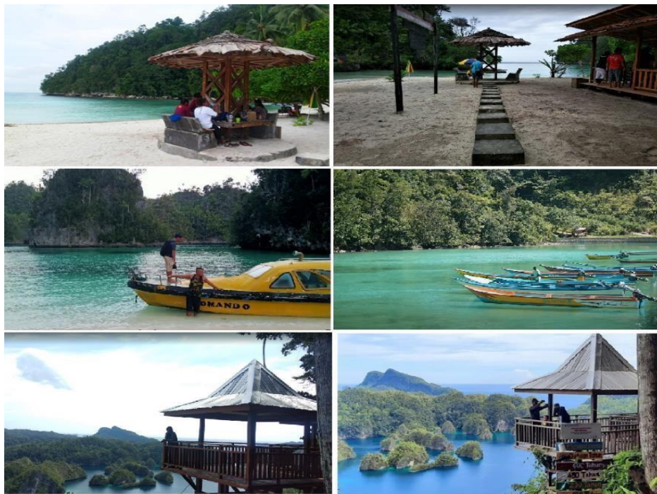
Gambar 5 Prasarana Teluk Triton. Sumber data : dokumentasi

laut (jonson) atau perahu motor laut dan tentu saja hal sulit dijangkau dikarenakan lokasi objek wisata di pulau kosong dan jauh dari permukiman masyarakat. Perjalanan menuju objek wisata dapat dilihat pada Gambar 5. Berdasarkan hasil wawancara dengan para wisatawan dijelaskan bahwa hanya bisa ditempuh dengan menggunakan transportasi laut (jonson) atau perahu motor dan objek wisata disana dikelola atau dijaga oleh masyarakat setempat.