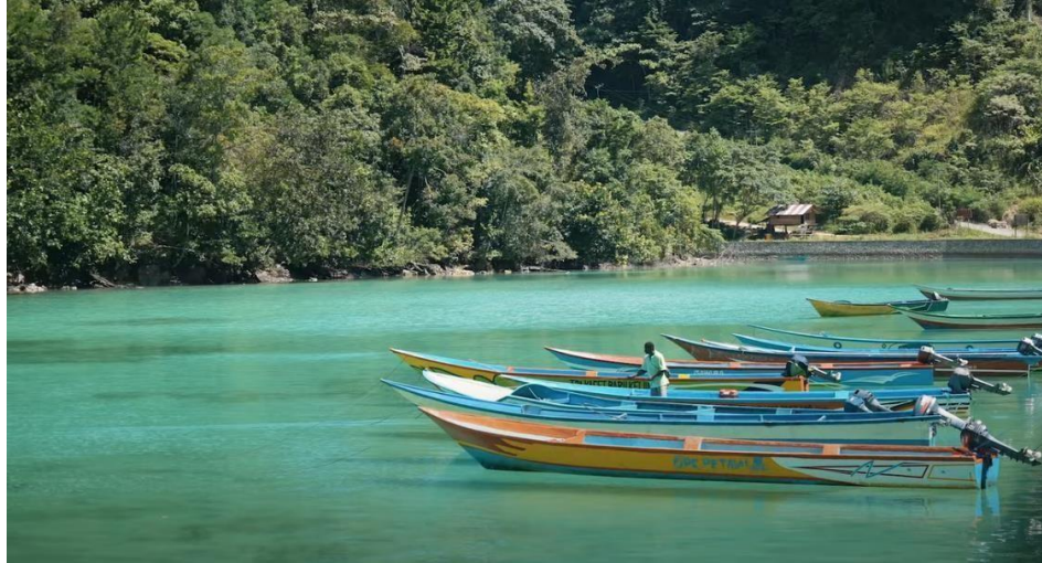
Gambar 6. Moda transportasi untuk ke Tempat Wisata.

Berdasarkan hasil wawancara dengan 15 warga masyarakat di Desa Lobo, Kabupaten Kainama terkait, apakah keberadaan objek wisata Teluk Triton bermanfaat bagi masyarakat setempat ?. Hasil wawancara menunjukkan bahwa sebesar 66,67 % atau sebanyak 10 responden yang berpendapat bahwa keberadaan cukup bermanfaat bagi masyarakat di Desa Lobo dan 5 responden atau sebesar 33,33% menjawab sangat bermanfaat.