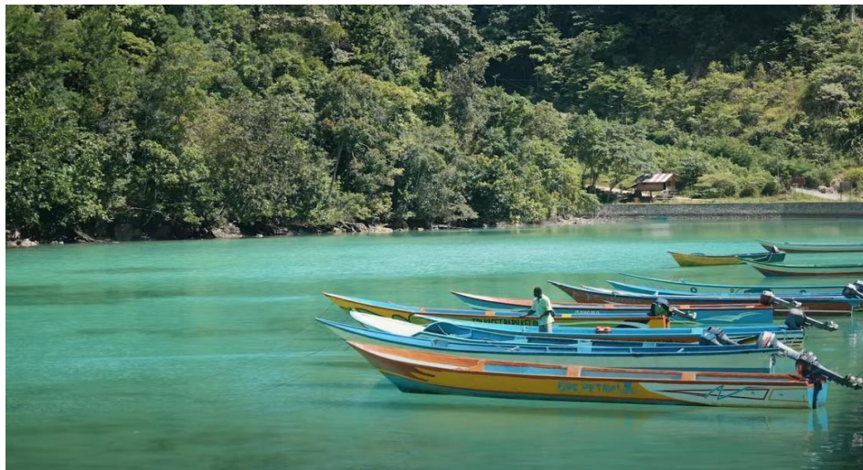
Gambar 6. Moda transportasi untuk ke Tempat Wisata.

Pariwisata?. Hasil observasi dan wawancara menunjukkan bahwa sampai saat ini belum ada bantuan sarana dan prasarana dari Dinas Pariwisata Kab. Kainama, sarana prasarana yang ada merupakan hasil kreatifitas dan usaha masyarakat setempat. Sampai saat ini masyarakat Desa Loba terus berupaya untuk mengembangkan dan mempromosi objek wisata di sana agar dapat menarik banyak wisatawan untuk berkunjung di sana.