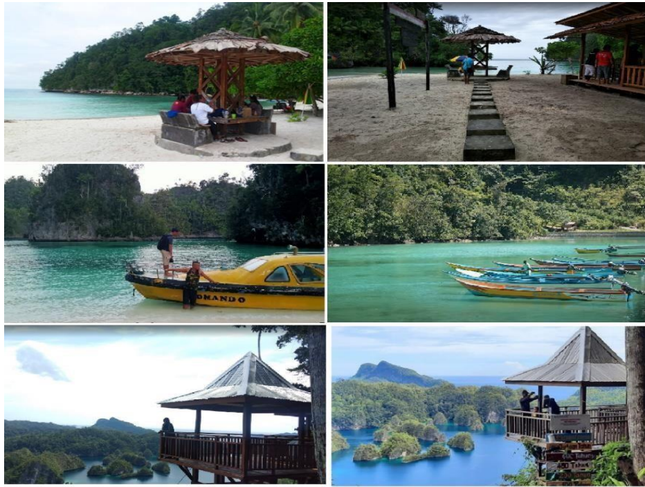
Gambar 5 Prasarana Teluk Triton.

Berdasarkan hasil wawancara dengan para wisatawan dijelaskan bahwa hanya bisa ditempuh dengan menggunakan transportasi laut (jonson) atau perahu motor dan objek wisata disana dikelola atau dijaga oleh masyarakat setempat.