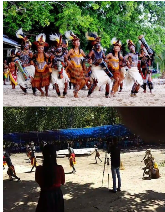
Gambar 2. Pertunjukan Seni Tari.

menjelaskan bahwa Teluk Triton merupakan salah satu objek wisata yang sangat indah dan memiliki potensi wisata yang sangat menarik, sampai saat Dinas Pariwisata Kabupaten Kaimana belum memberikan bantuan kepada pengelola objek wisata di Teluk Triton dikarenakan status kepemilikan dan pengolahan objek wisata disana yang masih dikelola oleh masyarakat setempat. Sampai saat ini sudah beberapa kali pemerintah Desa Lobo sudah mengajukan proposal pendanaan untuk pengembangan objek wisata disana tapi sampai sekarang belum ada respon atau balasan dari Dinas Pariwisata.