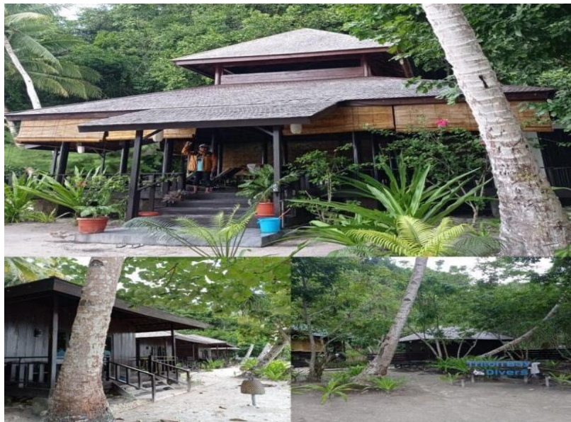
Gambar 3. Ketersediaan berupa Penginapan.

Hasil wawancara dengan 3 orang petugas dari Dinas Pariwisata Kabupaten Kaimana terkait seni pertunjukan apa saja yang pernah diadakan di teluk triton? Hasil wawancara menunjukan bahwa 3 responden berpendapat bahwa seni pertunjukan yang pernah diadakan di teluk triton yaitu seni tari dan syuting film.