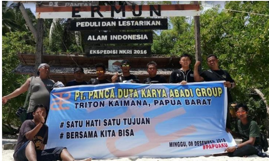
Gambar 7. Kerjasama Dalam Melestarikan Alam Indonesia. Sumber data: dokumentasi

menjaga kebersihan wisata Teluk Triton oleh Pemerintah Desa Lobo?. Hasil observasi dan wawancara menunjukkan bahwa Pemerintah Desa Lobo seringkali menganjurkan kepada wisatawan untuk tetap menjaga kebersihan di Objek Wisata Teluk Triton.