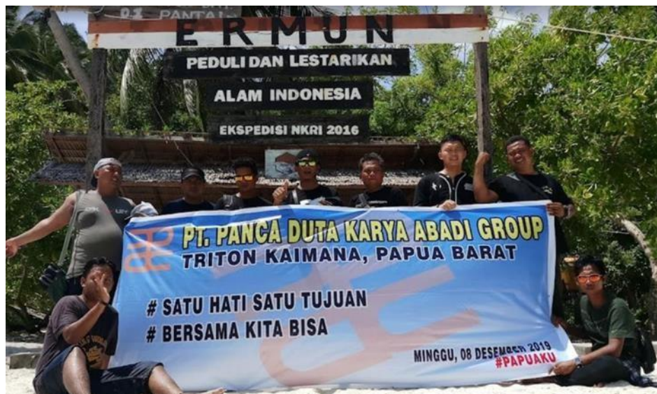
Gambar 7. Kerjasama Dalam Melestarikan Alam Indonesia. Sumber data: dokumentasi

Hasil wawancara dengan masyarakat setempat terkait, apakah masyarakat Desa Lobo melakukan aktifitas menjual makanan untuk wisatawan di Teluk Triton?. Hasil wawancara menunjukkan bahwa sebesar 86,67 % atau sebanyak 13 responden yang menjawab melakukan aktifitas menjual makanan untuk wisatawan di Teluk Triton, makanan atau jajan yang dijual pada umumnya merupakan makan khas daerah setempat dan sebanyak 2 responden atau sebesar 13,33% menjawab tidak melakukan. Hasil wawancara dengan masyarakat terkait, apakah masyarakat sering dianjurkan untuk menjaga kebersihan wisata Teluk Triton oleh Pemerintah Desa Lobo?. Hasil observasi dan wawancara menunjukkan bahwa Pemerintah Desa Lobo seringkali menganjurkan kepada wisatawan untuk tetap menjaga kebersihan di Objek Wisata Teluk Triton.