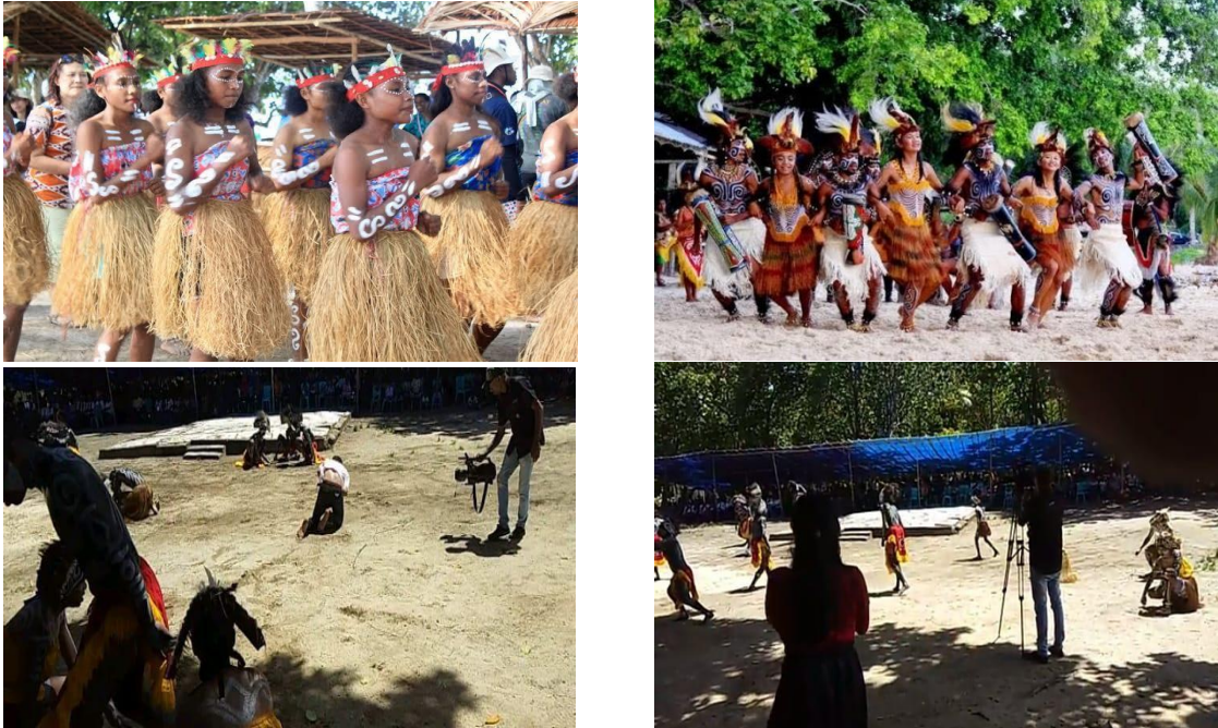
Gambar 2. Pertunjukan Seni Tari.

Pemda Kaimana melalui dinas Kebudayaan dan Pariwisata terus menyusun sejumlah program untuk mendukung pengembangan pariwisata di Kota 1001 Senja Kaimana. Terkait akan itu, beberapa program strategisnya adalah dengan menerapkan beberapa kampung sebagai kampung adat, rencana penerapan masterplant pengembangan Teluk Triton. Dengan terus menggenjot sejumlah program prioritas pengembangan kawasan pariwisata Kaimana, diharapkan pada Tahun 2025.