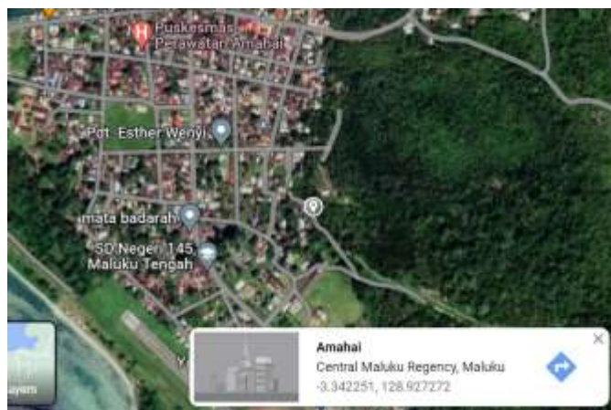
Gambar 1. Lokasi pengambilan sampel di Kecamatan Amahai, Kab. Maluku tengah