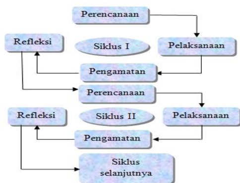
Gambar 1. Siklus Model PTK (Arikunto 2008: 83)

Penelitian tindakan kelas (PTK) ini terdiri dari 2 siklus. Kedua siklus dilaksanakan sesuai dengan perubahan yang ingin dicapai.