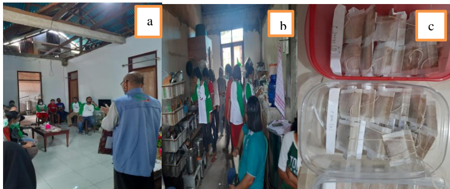
Gambar 2. Pengarahan dan pemberian materi pelatihan (a), Kegiatan pelatihan (b) Dan produk teh kulit pala (c)

Pada tahap persiapan dilakukan survei ke lokasi pengabdian melalui pendekatan dengan Pemerintah Desa Lilibooi untuk memperoleh ijin pelaksanaan kegiatan (tempat dan waktu pelaksanaan kegiatan) dan kerjasama mempersiapkan peserta pelatihan (kelompok tani Mawar). Kegiatan pelatihan diawali dengan pengenalan beberapa peralatan sederhana yang dapat digunakan di desa untuk menunjang proses pelatihan pembuatan teh herbal kulit buah pala.