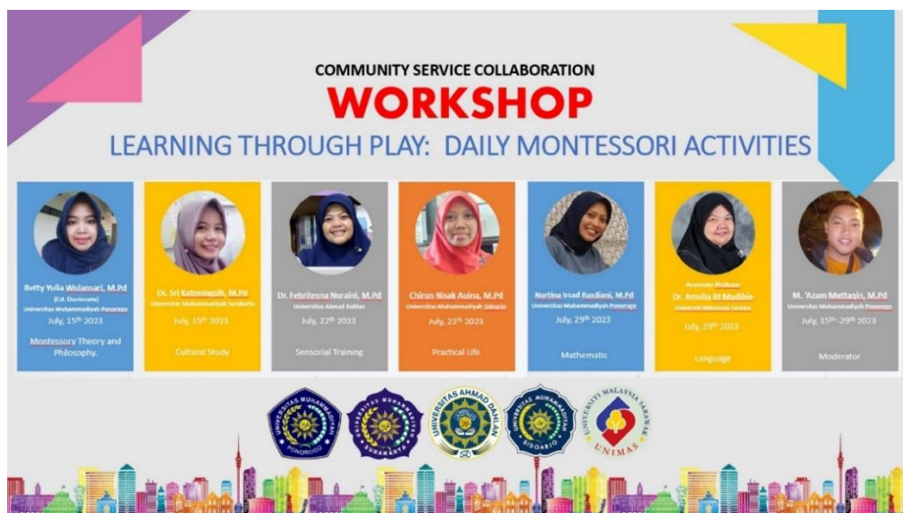
Gambar 1. Flyer Pelaksanaan Kegiatan