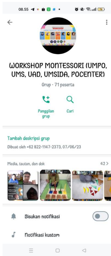
Gambar 2. Group Whatsapp peserta sebagai tempat info workshop