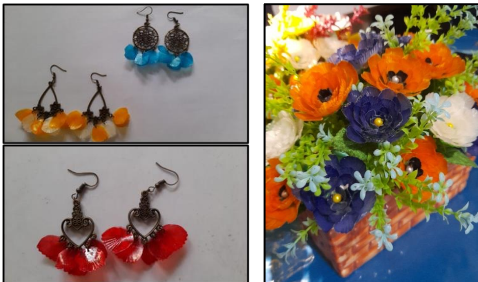
Gambar 4. Produk Hasil Pelatihan