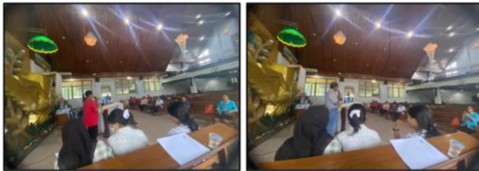
Gambar 3. Penyampaian Materi Oleh Narasumber

berbahan baku limbah sisik ikan, tidak mengeluarkan biaya produksi yang mahal tetapi dapat dijual dengan harga yang tinggi dapat meningkatkan pendapatan masyarakat. Hal ini sebagaimana yang dilakukan oleh nelayan buruh di Kelurahan Tegalsari dan Muarareja Kota Tegal untuk membantu meningkatkan pendapatan keluarga (Kusnadi et al., 2018).