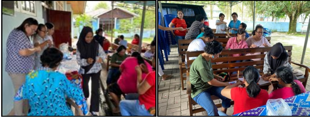
Gambar 4. Pelatihan Pembuatan Aksesoris dan Bunga Hias Berbahan Baku Sisik Ikan

Proses pembuatan produk tersebut terdiri dari 4 tahapan yaitu (Kusnadi et al., 2018; Arina et al., 2019; Atamtajani & Amelia, 2019):