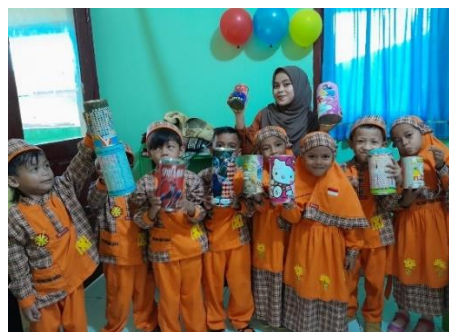
Gambar 5. Pemberian Cendramata Celengan

Selain ekspresi keseriusan yang ditampilkan, juga terlihat dari sejumlah pertanyaan yang disampaikan pada sesi tanya-jawab, terdapat beberapa pertanyaan yang disampaikan dari peserta sosialisasi yang merupakan anak-anak usia dini yaitu utamanya tentang manfaat yang akan diperoleh ketika menabung, dampak jika tidak menabung, apa yang harus dilakukan jika tidak mempunyai uang jajan untuk ditabung.