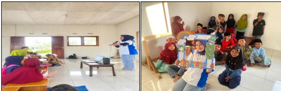
Gambar 3. Proses Sosialisasi

Kegiatan sosialisasi berlangsung dengan baik. Pemaparan materi berlangsung selama kurang lebih 60 menit selama 2 hari. Diawal pemaparan materi, peserta sosialisasi sudah sangat antusias, yang mana hal itu terlihat dari sejumlah siswa yang memperhatikan dengan baik serta tidak berisik.