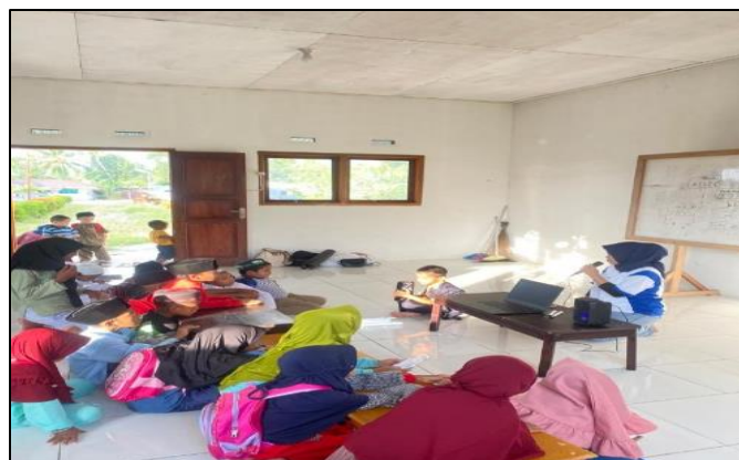
Gambar 2. Pembukaan dan Perkenalan Diri

Kegiatan Sosialisasi Pengelolaan Keuangan Guna Mengurangi Perilaku Konsumtif Pada Anak Usia Dini di Desa Waimital, Kecamatan Kairatu, Kabupaten Seram Bagian Barat dilaksanakan secara informal dengan sistematis dan terstruktur. Kegiatan ini diawali dengan registrasi dan terdapat 15 peserta yang merupakan anak-anak usia dini yang ada di Desa Waimital RT/RW : 05/01. Kegiatan dimulai dengan pembukaan dan perkenalan diri untuk menjelaskan maksud dan tujuan kegiatan ini dilaksanakan.