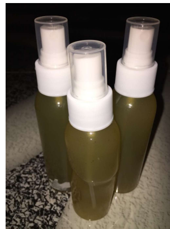
Gambar 3. Bahan dan Hasil Hand Sanitizer dari Kegiatan Pengabdian Di Negeri Rumahtiga