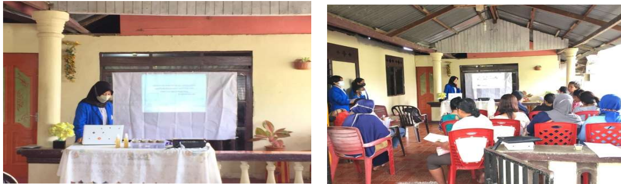
Gambar 2. Sosialisasi Pembuatan Hand Sanitizer Alami.

kader Negeri Rumahtiga sangat antusias dan semangat hal tersebut terlihat dari kehadiran yang melebihi target undangan.