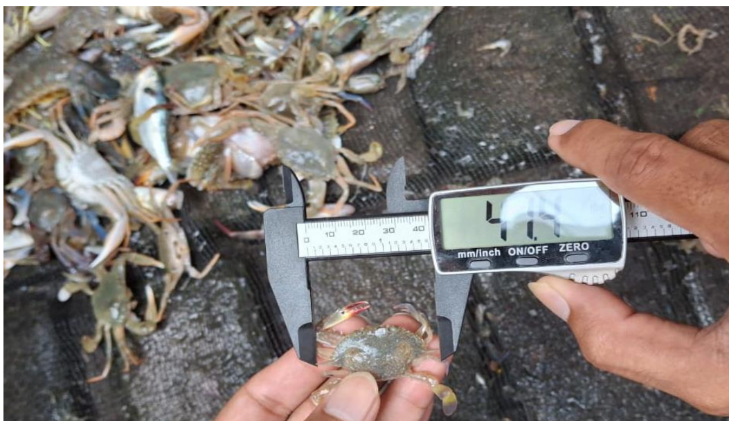
Gambar 2. Pengukuran lebar karapas

Rajungan layak tangkap memiliki ukuran lebar karapas \geq 10 cm. Untuk mengetahui proporsi rajungan layak tangkap digunakan rumus sebagai berikut (Jamal et al., 2024):