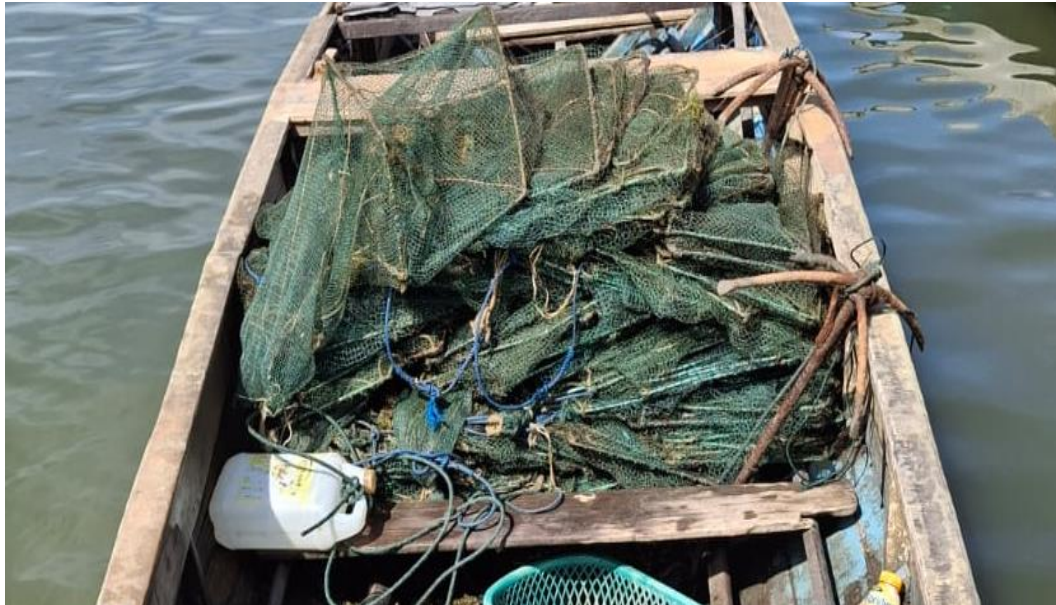
Gambar 1. Alat tangkap bubu naga