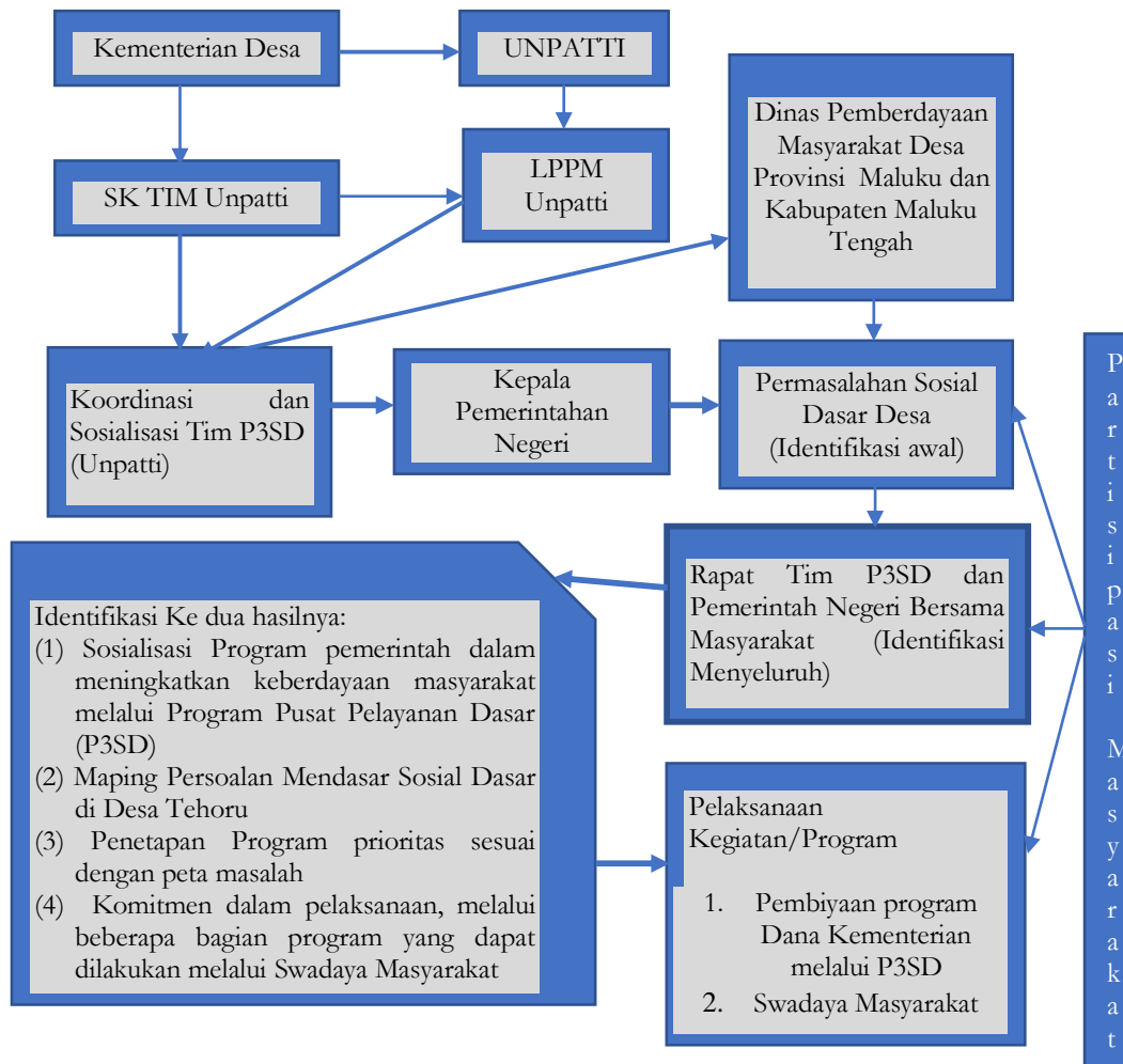
Gambar (1). Partisipasi Masyarakat pada Persiapan Program

Tahapan persiapan program P3SD, dimulai dari Kementerian Desa bekerjasama dengan Universitas Negeri terpilih di Indonesia dan Unpatti di Maluku, melalui Lembaga Penelitian dan Pengabdian Kepada Masyarakat membentuk tim pelaksana. Gambar satu menjelaskan bahwa, program yang direncanakan tidak ditetapkan secara sepihak oleh pemerintah desa namun di tetapkan secara bersama melalui mekanisme aturan adat (Mayam Sangadji, Muspida, 2019) aturan adat dalam kelembagaan desa yaitu Rapat Saniri Negeri , dengan bahasa yang lain bahwa kelembagaan saniri negeri adalah merupakan wadah untuk berpartisipasi komunitas atau masyarakat. Oleh Priyono dan Pranaka 1996 partisipasi itu menggambarkan sebuah proses. Saniri Negeri merupakan rapat yang dilakukan oleh pemerintah negeri yang di hadir oleh seluruh masyarakat Pemerintahan negeri ini didalam strukturnya meliputi seluruh kepala-kepala Soa. Kepala Soa merupakan perwakilan marga yang terhimpun dalam satu persekutuan marga, yang diangkat untuk masuk